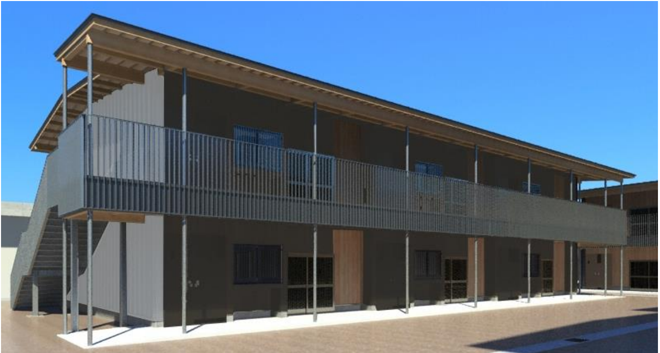
《市営木曽町住宅松棟》